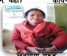
छिनुमाया गुरुड कार्यपालिका सदस्य