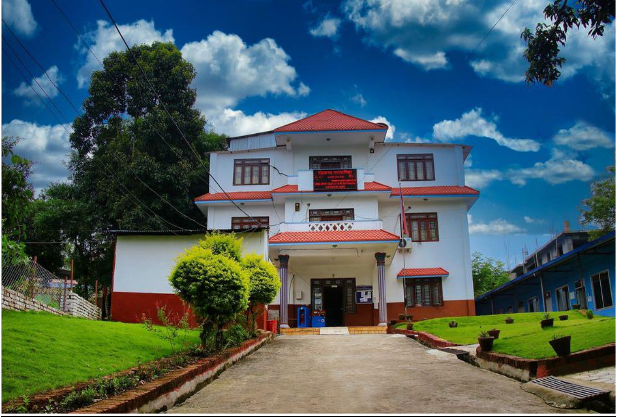
नीलकण्ठ नगरपालिका, नगर कार्यपालिकाको कार्यालय भवन धादिङवेसी