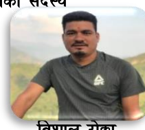
विशाल रोक्छा कार्यपालिका सदस्य