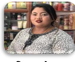
चिनामाया श्रेष्ठ कार्यपालिका सदस्य