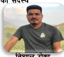
विशाल रोक्छा कार्यपालिका सदस्य