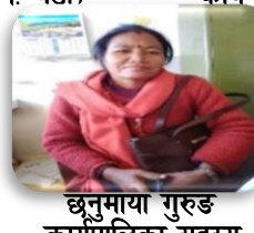
छुनुमाया गुरुड कार्यपालिका सदस्य