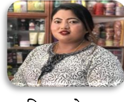
चिनामाया श्रेष्ठ कार्यपालिका सदस्य