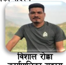
विशाल रोक्खा कार्यपालिका सदस्य