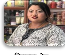
चिनामाया श्रेष्ठ कार्यपालिका सदस्य