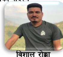
विशाल रोक्छा कार्यपालिका सदस्य