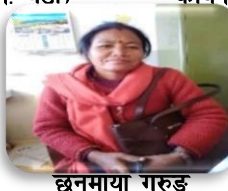
छिनुमाया गुरुड कार्यपालिका सदस्य