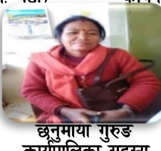
छुनुमाया गुरुड कार्यपालिका सदस्य