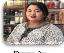
चिनामाया श्रेष्ठ कार्यपालिका सदस्य